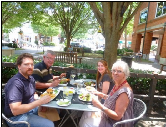
Genoeglijk samenzijn in Princetown