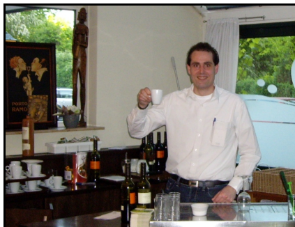
Onze gastheer, serves like a Lion