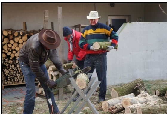
Houthakken bij Arnold & Hasha