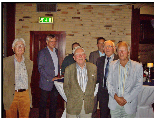
De jarigen worden uit volle borst toegezongen