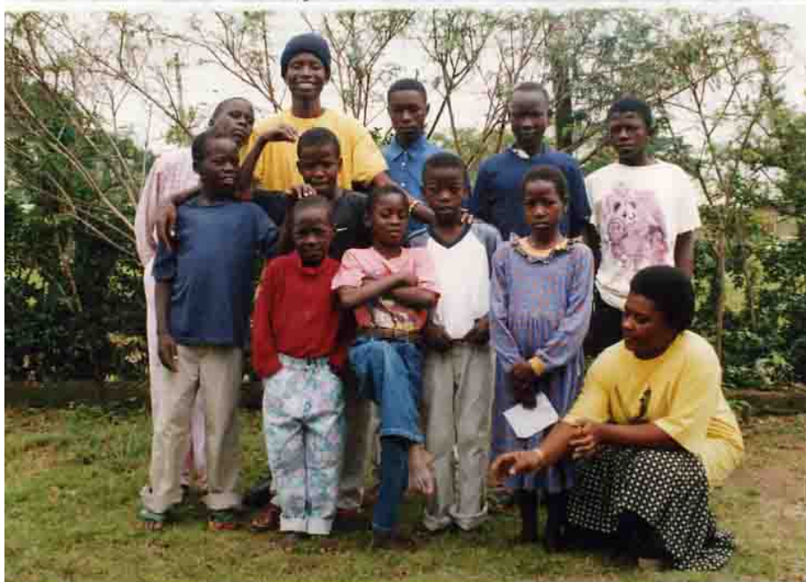
De kinderen in hun nieuwe kleren, gekregen na ons Paasfeest.